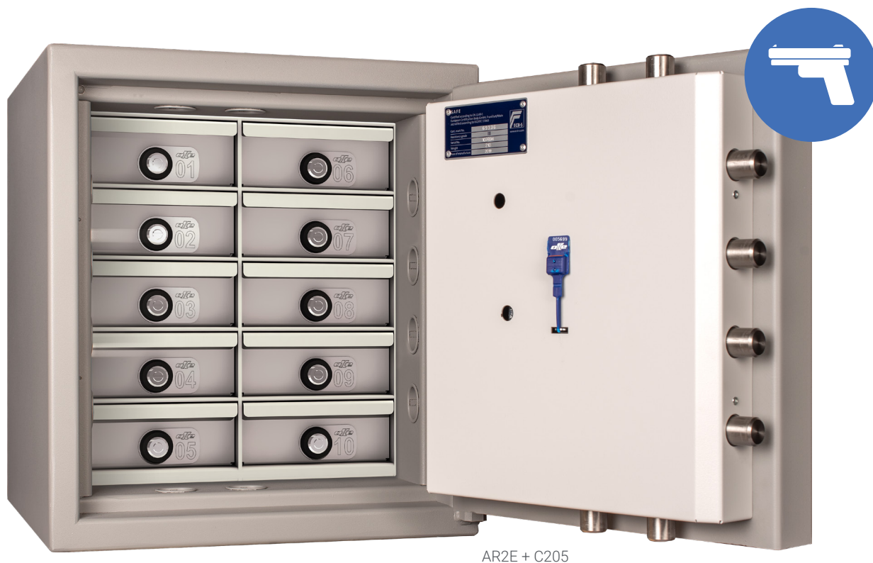
AR2E + C205

Compartiments pratiques pour les coffres des Séries III et IV. Totalement configurables pour toutes les tailles de coffres et équipés d'une serrure numérotée.